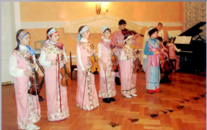
Бояре, а мы к вам пришли!