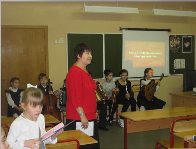
Концерт в общеобразовательной школе