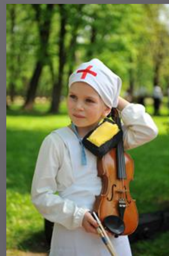
9 мая. Санитарка