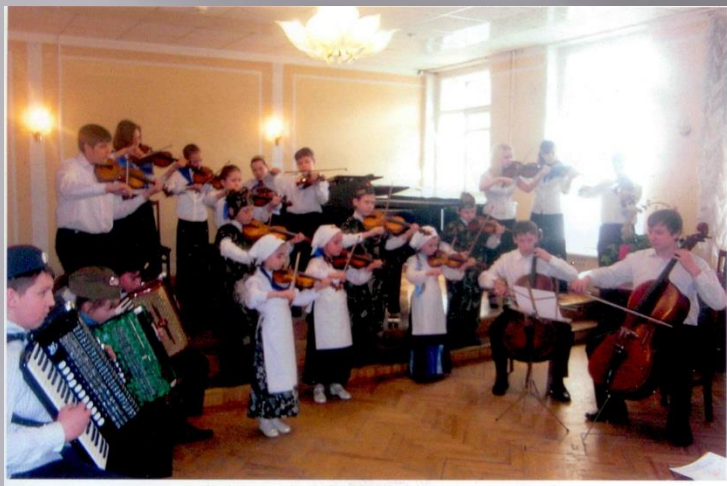
65 лет Победы. «Два военных вальса».