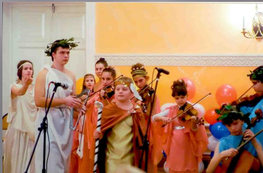
Мы - греки