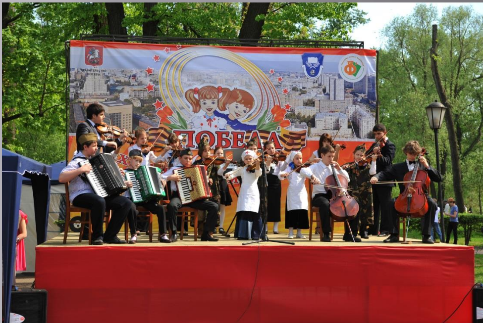
9 мая Концерт в Лефортовском парке.