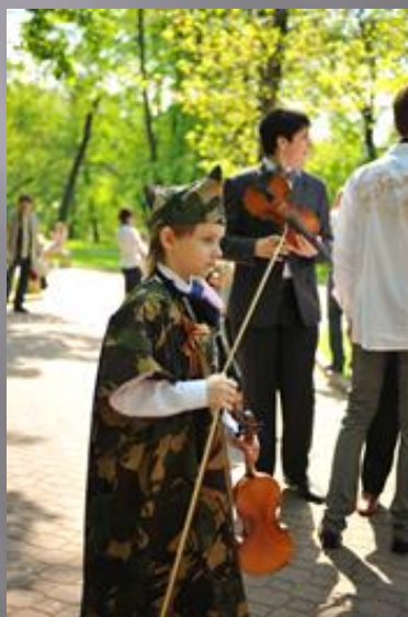
9 мая. В камуфляже