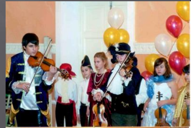
Мы в Италии. Наша лодка «Санта-Лючия»