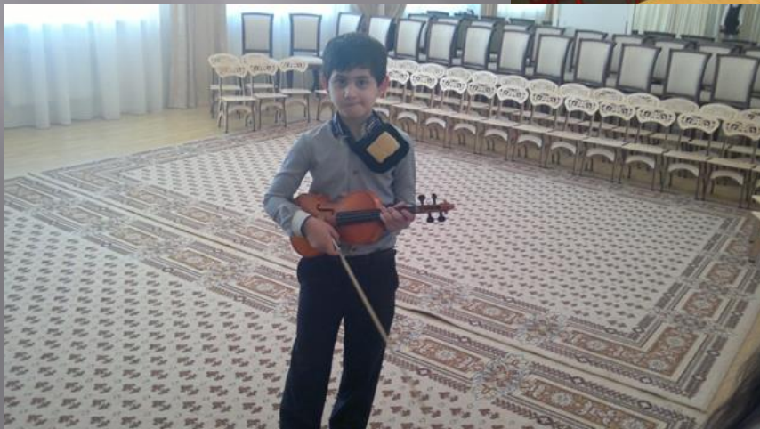
Концерты в детских садах