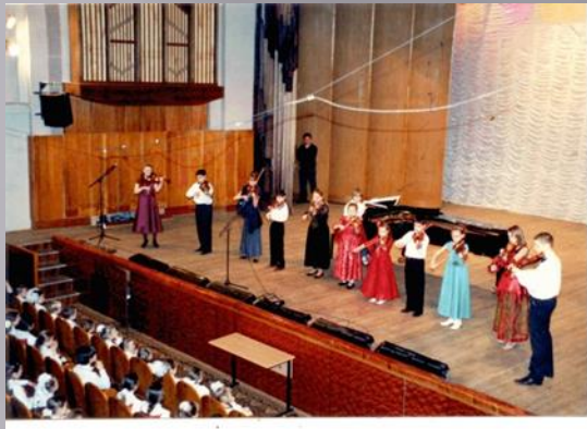
Концерты в зале Академии имени Гнесиных