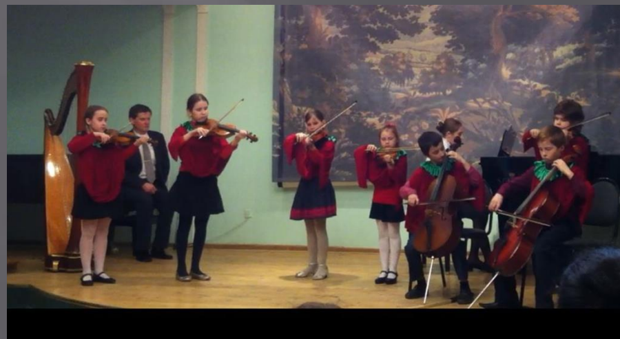
«Выход сеньора Помидора»