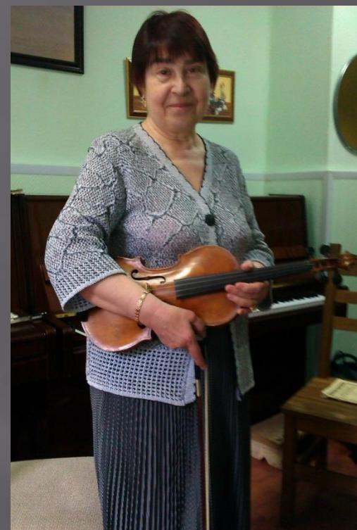
Инна Борисовна Гороховская