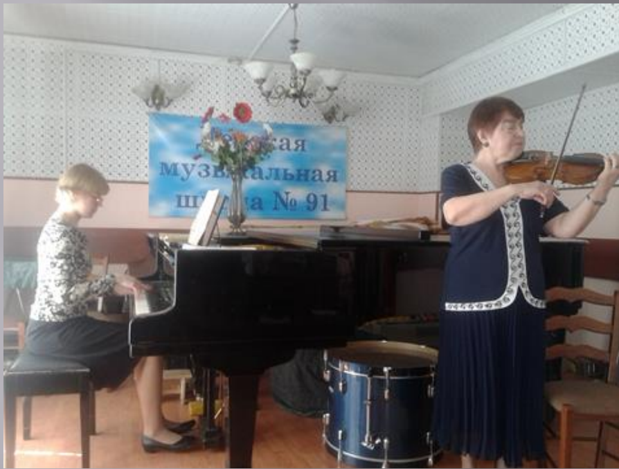
Мастер-класс после концерта